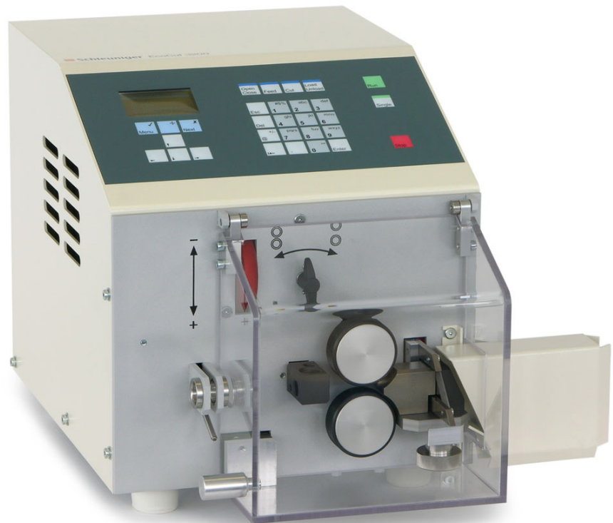
EcoCut 3200 全自动电缆切线机